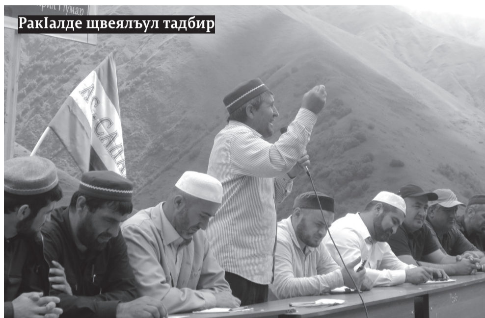
Рақалде щевялъул тадбир