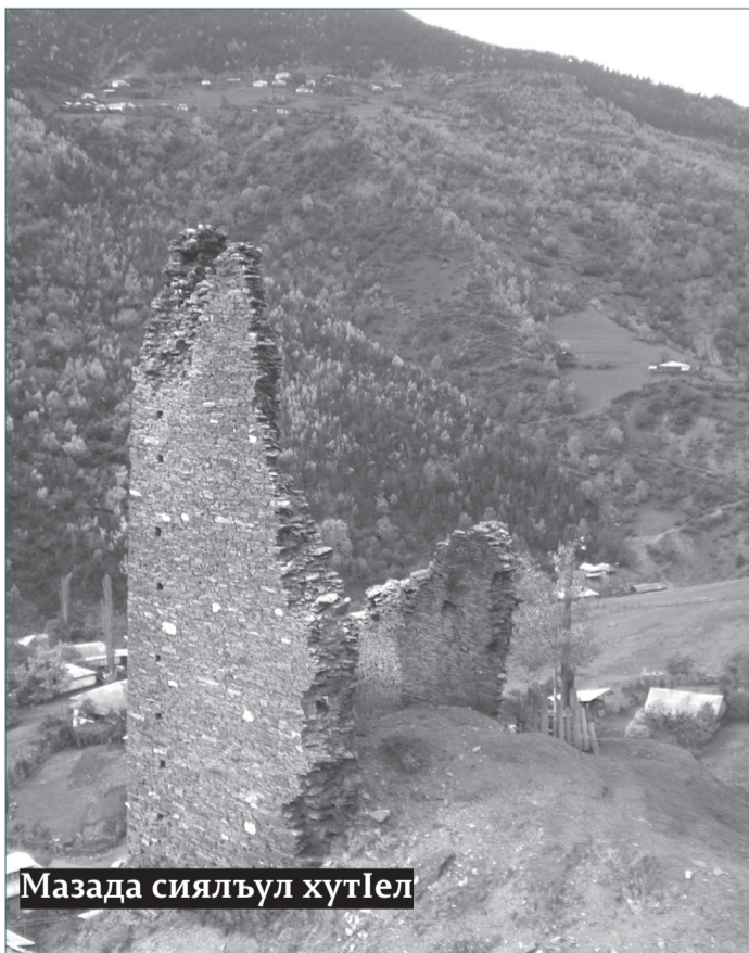
Мазада сиялъул хутIел

Нилъер регионалда бищун кIудияб культурияб ва тарихияб бечельилъун рикIкIине бегъула бакI-бакIалда ругел ганчIил сиял. Гъезул цоял цIакъго хашаб, къачIазе ккараб хIалалда руго, цогидал гIасрабаздаса хадур жеги лъикIалан цIунун хутIун руго. Гъезде тIоцебе кIвар бусинабун букIана араб сональ республикаялъул бетIер Рамазан ГIабдулатIиповас. Мисалалъе жиндирго росулъ бугеб хъалаги бачун букIана. Чанго къоялдаса регионалде рачIана "Я помощник президента" абураб къокъаялъул ГIолохъаби, дандчIвана регионалъул нухмалъулелгун, бицана гъеб иш жидеца тIаде босулеб бугин. Амма гъелдалъун иш лъугIана.